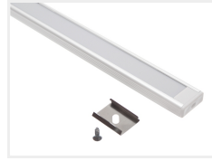
Hvid med frostet front, 2 meter