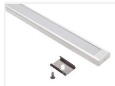
Tilbehør, Hvid ende uden hul