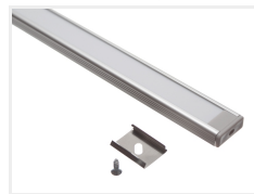
Tilbehør, Grå ende uden hul