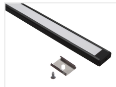
Tilbehør, Sort ende uden hul