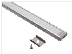
Tilbehør, Grå ende med hul