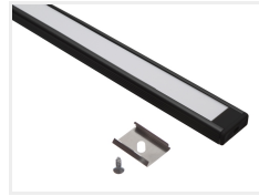
Sort med hvid front, 2 meter