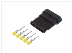
Han, 5 poler