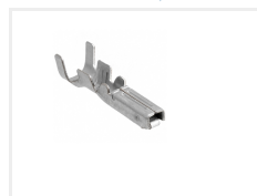
Løsdele, Hun-terminal 0.75 - 1.5mm 2