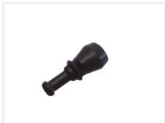
Gummibase, 1 positioner