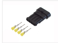
Han, 4 poler