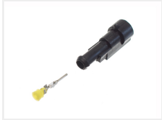
Han, 1 pol