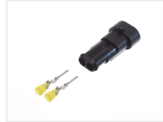
Han, 2 poler