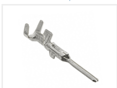
Løsdele, Han-terminal 0.75 - 1.5mm 2