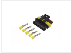
Hun, 5 poler