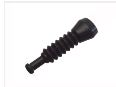
Gummibase, 2 positioner