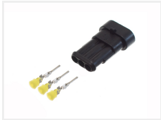
Han, 3 poler