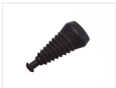
Gummibase, 3 positioner