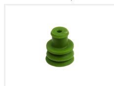
Løsdele, Pakning Grøn 1.2 - 1.6mm