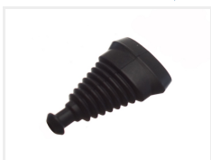
Gummibase, 5 positioner