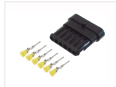
Han, 6 poler