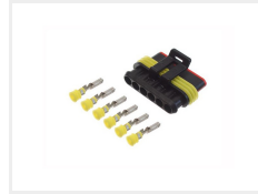
Hun, 6 poler