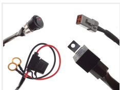
12V, 1 x 2-pin ATP stik