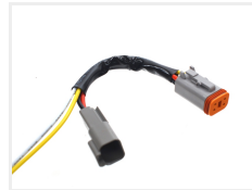
Tilbehør, Adapter kabel - 4-pin til 2-pin