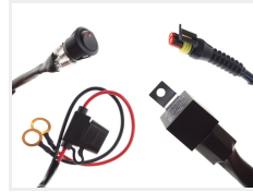
12V, 1 x 2-pin Superseal I.5 stik