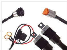
12V, 1 x 3-pin Deutsch DT stik