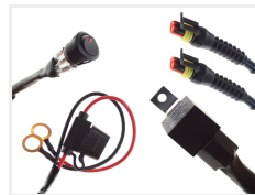
12V, 2 x 2-pin Superseal I.5 stik