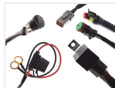
24V, 1 x 2-pin ATP stik