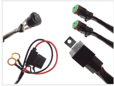
12V, 2 x 2-pin Deutsch DT stik