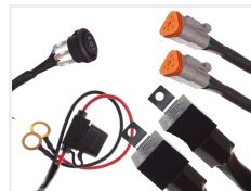
12V, 2 x 3-pin Deutsch DT stik