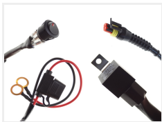
24V, 1 x 2-pin Superseal I.5 stik