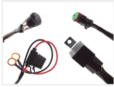
12V, 1 x 2-pin Deutsch DT stik